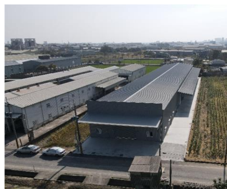
圖五：台南市歸仁區已經蓋好且大門深鎖的廠房