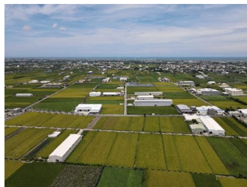
圖三：彰化縣和美鎮農地違章工廠

當我們在討論農地違章工廠時，其實農地違章工廠不是無中生有，它是一個漸進式的成長，可以區分為三個階段，第一階段是「 尚未有建物 」，可能農地正在鋪水泥或打地基；第二階段是「 正在蓋建物 」，通常是綁鋼筋、上梁柱、貼鐵皮等；第三階段是「 廠房完成 」，廠房內有加工製造事實者，稱作農地違章工廠。廠房內囤有物品、無加工製造者，稱作農地違章倉儲，如果大門深鎖無法窺知使用、空廠房等，以上三種情境都會被視為農地違章廠房（如表四）。