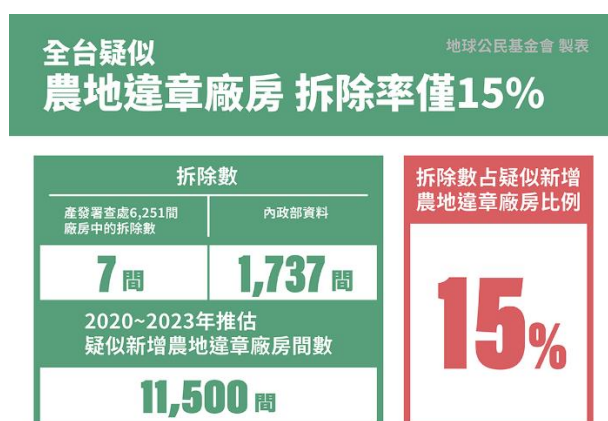
圖八：全台灣疑似農地違章廠房拆除情形

依據農業部農業及農地資源盤查結果資料，《工輔法》2020年修法上路至2023年，農地上的疑似工廠面積新增了2,857公頃，以一間農地違章廠房約0.25公頃來推估，約有11,500間。依據經濟部產發署公開2022~2024年已查處的疑似農地違章工廠的數量約6,251間 13 ，但最後只有7間拆除。我們也向內政部索資，發現2021~2023年間，全台拆除正在蓋的農地違章廠房數量約800間，拆除已興建完成的廠房約937間，總計拆除1,737間。若以推估疑似新增農地違章廠房11,500間來看，拆除率大約15%（參考圖八）。