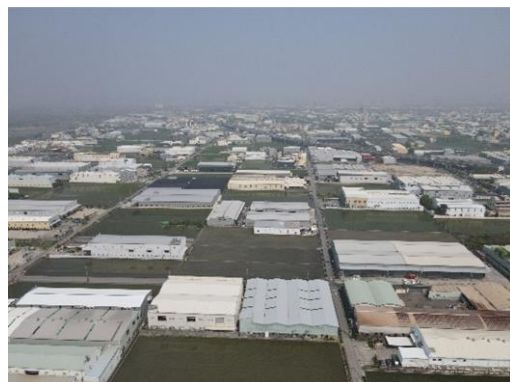
圖二：台中市烏日溪南農地違章工廠